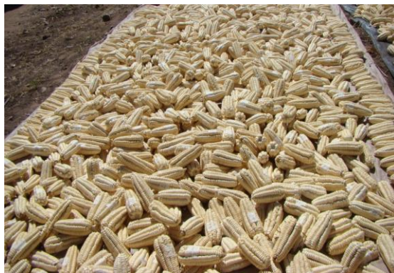
Foto 1: Mazorcas de plantas seleccionadas en campo con características típicas de la Raza Cusco (8 hileras con buena calidad de grano).

Para lograr una buena emergencia y plantas vigorosas utilizar semilla de tamaño uniforme procedente del tercio medio de las mazorcas típicas de ocho hileras, tratada antes de la siembra con el fungicida o insecticida adecuado aplicando las dosis indicadas en los envases de estos agroquímicos.