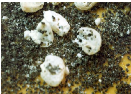
Foto 14: Granos atacados por gorgojos del maíz ( Pagocerus frontalis )

Como alternativa a los depósitos y donde no haya roedores (ratas y ratones) se recomienda el uso de bolsas gigantes de polietileno grueso transparente, en los que se deposita la semilla o grano y se trata con las tabletas de fosfatina. El plástico transparente permite ver si hay o no presencia de gorgojos. Durante el tiempo de almacenado del maíz se debe monitorear (muestrear) la presencia de gorgojo.