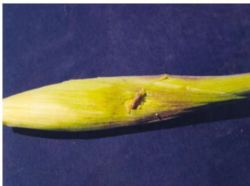
Foto 10: Salida del gusano choclero o hutuscuru ( Helicoverpa zea )

Para el control del gusano choclero existen varias tecnologías disponibles: liberar microavispa del género Tichogramma ; instalar trampas de luz oscura; aplicar 3 gotas de aceite comestible vegetal sobre los “pelos” de cada choclo cuando estos hayan alcanzado el estado de pincel, en tres oportunidades cada 8 días.