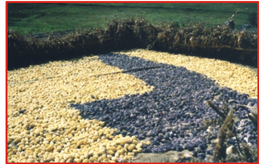
Figura N° 1: Chaquichiy o secado tradicional de maíz.

El "chaquichiy", es el secado tradicional en tendales sobre paja y cerco de chala, donde también separan las mazorcas inmaduras y podridas, luego las clasifican por colores de grano y variedades.