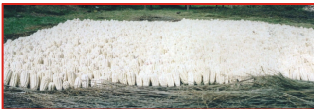
Figura N° 7: Maíz blanco gigante de Cuzco