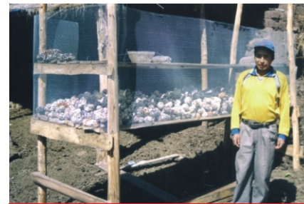
Figura N° 6: Mazorcas en el secador de maíz