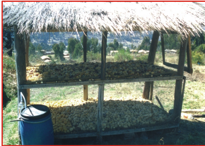
Figura N° 2: Secador de maíz.

En las comunidades de Pisac, donde practican esta forma de secado, las mazorcas quedan expuestas a las lluvias extemporáneas que ocurren entre los meses de mayo a julio, ocasionando pérdidas de hasta el 30% de la cosecha debido a la pudrición de mazorcas y el manchado de los granos, disminuyendo su calidad.