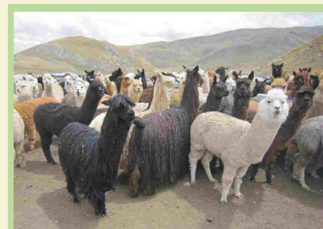
Rebaño de alpacas de color - Puno

La distribución de variación haplotípica mitocondrial en la región Puno (ver mapa), permite identificar zonas importantes para la conservación de la riqueza genética de alpacas de color (ej. Mazo Cruz), y es una herramienta útil para los criadores ya que podrán identificar los sitios idóneos para adquirir reproductores que permitan hacer un refrescamiento genético en sus rebaños y así evitar la consanguinidad.