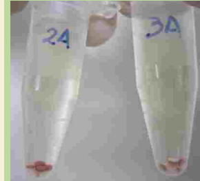
Toma de muestras

Las alpacas son fuente de fibra, carne y otros subproductos por lo que son una especie importante económicamente para un amplio sector de las poblaciones altoandinas de nuestro país, principalmente en la región Puno la cual alberga la mayor población de alpacas del país. Sin embargo, los esfuerzos de conservación, manejo y mejoramiento genético no han avanzado más allá del logrado por las técnicas tradicionales empleadas en las comunidades alpaqueras.