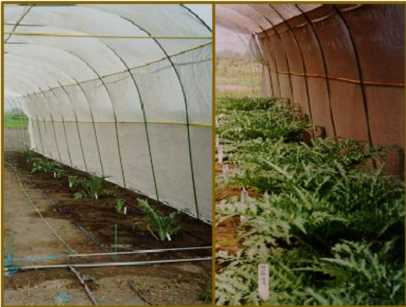
Foto 8 Plantas de alcachofa sin espinas en invernadero

Luego de la aclimatación se pasa las plántulas a bolsas grandes con sustrato de arena y humus en una proporción de 1:1 donde permanecen 5 semanas; estando listas para el trasplante del invernadero de camas desinfectadas o bolsas a campo. Se cortan las hojas para estimular el prendimiento, trasplantando a raíz desnuda previa desinfección ó con sustrato. En invernadero se realizan las evaluaciones de planta y de sanidad. La presencia de virus se realiza con plantas indicadoras ( Chenopodium quinoa y Gomphrena globosa ) por inoculación mecánica para detectar virus del enamismo y del moteado que son los más difundidos en nuestro país.