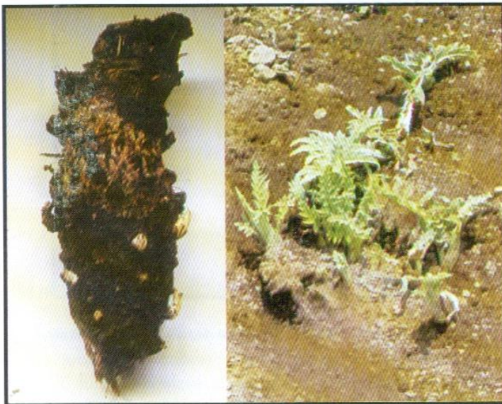
Foto 1 Hijuelos y yemas de alcafofa sin espinas óptimas para disección de meristemas

En laboratorio se enjuaga con abundante agua de caño y se elimina todas las hojas, dejando solo la yema con dos hojas en formación, completamente limpia. Luego se corta los lados y la base de la yema, dándole forma cuadrangular para facilitar su manipuleo al momento de realizar la disección del meristema.