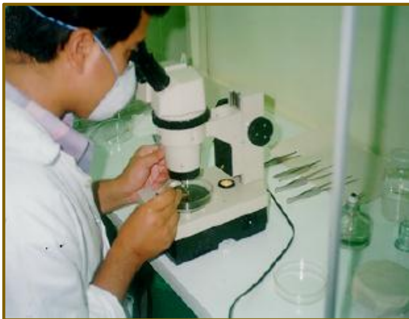
Foto 3 Disección de meristema de alcachofa en condiciones asépticas

La disección (corte) del meristema apical se realiza cortando los primordios en formación y dejando dos primordios foliares y el domo meristemático, evitando la fenolización del tejido, que puede producir el necrosamiento del meristema.