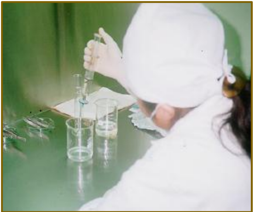
Foto 2 Esterilización por filtración de solución antioxidante

Las yemas obtenidas se deben lavar con agua de caño y luego 3 veces con agua destilada; en la cámara de flujo laminar se sumerge las yemas en alcohol 70% durante 2 minutos para facilitar la penetración del desinfectante. La desinfección se realiza con Hipoclorito de Sodio al 1% durante 12 minutos y se enjuaga 3 veces con agua esterilizada para eliminar todo residuo y luego se coloca en una solución antioxidante de ácido ascórbico al 0,1% para evitar la fenolización que es el necrosamiento del tejido afectado a causa de la segregación de elevadas concentraciones de polifenoles que son producidos por la planta como respuesta al daño.