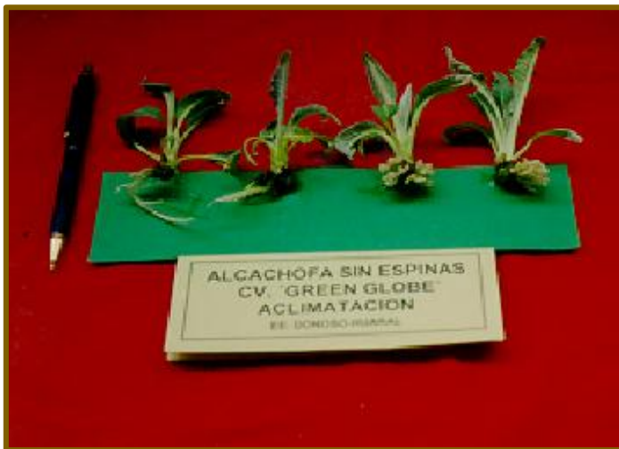
Foto 6 Formación de sistema radicular en alcahofa