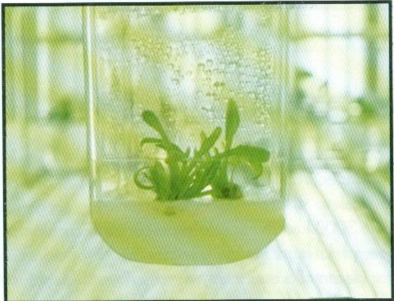
Foto 5 Microplanta de alcachofa en multiplicación

Después que las microplantas alcanzan el tamaño promedio de 2 cm se transfieren a cajas de polipropileno (magentas) o frascos de vidrio, colocándose 1 ó 2 brotes por envase, en un medio de multiplicación. (Ver anexo 1 y 2). Luego de 6 a 7 semanas se obtiene en promedio 6 brotes por microplanta, donde la mitad alcanza el tamaño necesario para realizar un subcultivo ó pasar a la fase de enraizamiento (Ver anexo 3).