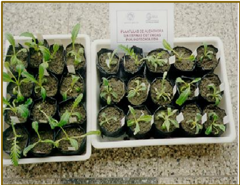
Foto 7 Plántulas de alcachofa en aclimatación

Las raíces de las plántulas se lavan bien sin dejar restos de agar adheridos a las mismas, para evitar que los hongos patógenos se alimenten ellos y causen pudrición radicular sujetando delicadamente las plántulas para no quebrar las raíces que no son muy flexibles. El sustrato es de arena de río lavada y esterilizada, la cual se coloca en bolsas negras pequeñas con orificios y se riega ligeramente; la temperatura debe fluctuar entre 22°C a 23°C para evitar marchitamiento de las plántulas, las que deben permanecer en aclimatación durante 4 semanas como promedio.